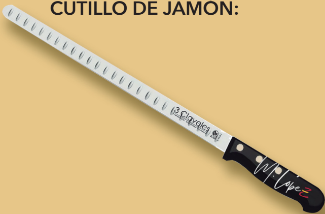
CUTILLO DE JAMÓN: